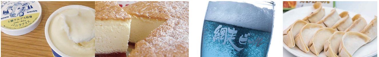
十勝アルプス牧場 アイスギフトセット (清水町)

※選べる北海道ギフトは29点(2023/9時点)ギフトのラインナップは変更の可能性がございます。 ※写真はイメージです。